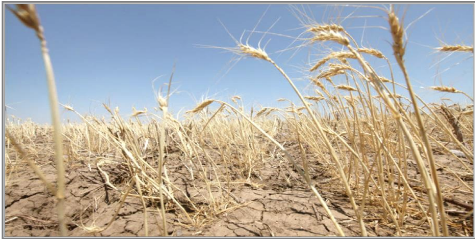
شکل ۲: خشکی و شدت کاهش محصولات در نبات گندم (۱).