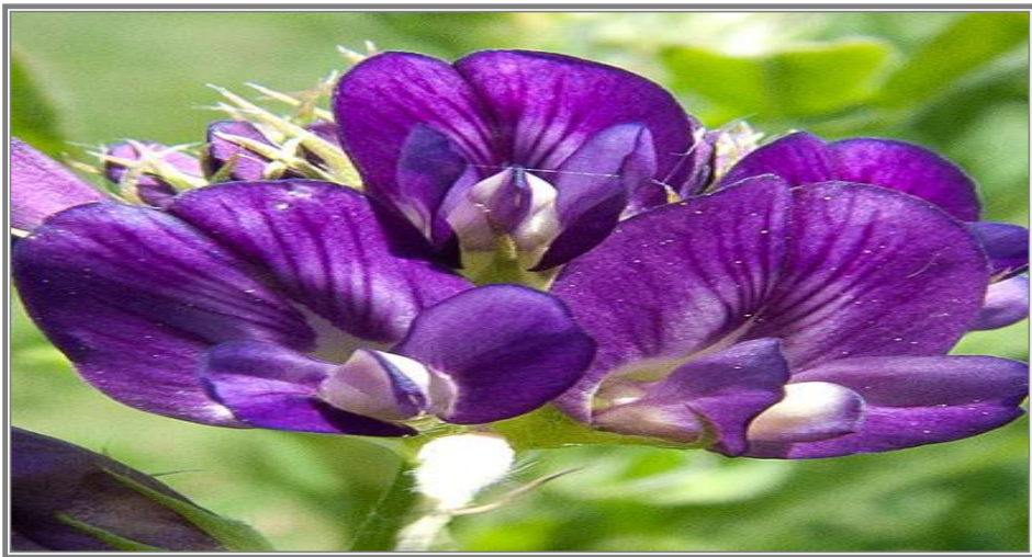
شکل ۱: گل رشقه

آزاد شدن پایه‌ی جنسی که در اثر متورم شدن یا شادابیت گل به وقوع می‌پیوندد، توأم با یک عمل منفجرشونده، مانند آزاد شدن یک فنر زیر فشار می‌باشد. آزاد شدن پایه‌ی جنسی به صورت طبیعی یا توسط تکان میخانیکی، باد، باران یا آفتاب اکثراً گرده‌افشانی خودی و تولید تخم کم را تحریک می‌نماید. زمانی که نباتات رشقه‌ی خود گرده‌افشان باشند، ناسازگاری خودی (self-incompatibility) جزئی و عدم تکامل تخمه (ovule abortion) به فیصدی پایین القاح می‌انجامد. القاح خالص ۶ روز بعد از گرده‌افشانی در نباتات که به صورت غیرخودی القاح شده باشد، می‌تواند نسبت به نباتات که به صورت خودی القاح شده‌اند، ۶ مرتبه بیشتر باشد. زمانی که حشرات بالای گل‌ها گردش می‌نمایند گرده را از نباتات مختلف انتقال داده، باعث القاح غیرخودی و تشکیل تخم می‌شوند. کفیدن سطح کلاله توسط گردش حشرات برای دخول لوله‌ی گرده ضروری می‌باشد. بعد از آزاد شدن پایه‌ی جنسی اندازه‌ی رطوبت مناسب برای جوانه زدن گرده و نمو لوله‌ی گرده باید حفظ گردد تا القاح انجام یابد (۱۰).